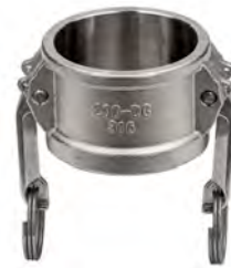
Нержавіюча сталь AISI 316