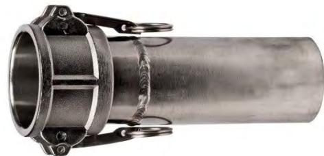
Муфта з'єднувальна мамка CAMLOCK приварюється встик до безшовної труби EN 10216-2 (номенклатура труби: MPR-RBSZ-060X2.9-SS321) зі сталі AISI 321.