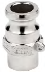
Нержавіюча сталь AISI 316