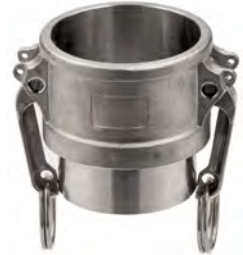
Нержавіюча сталь AISI 316