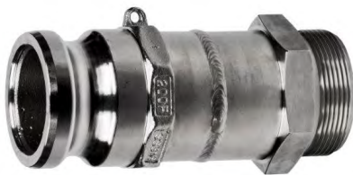
Втикова частина CAMLOCK, приварена до з'єднання з зовнішньою різьбою BSP (номенклатура кінцевиків): ТК-WGZ-050-200).