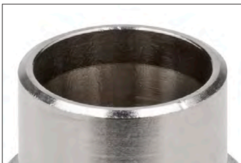
Y-подібний скіс 30°