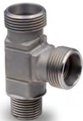
Тип BT і MT