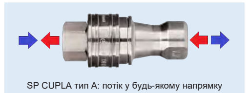
SP CUPLA тип А: потік у будь-якому напрямку

Двосторонньо відсікаюче швидкороз'ємне з'єднання для середнього тиску високої якості та відмінної довговічності. Характеризується низьким рівнем витоків при роз'єднанні та низьким рівнем потрапляння повітря в систему при з'єднанні. Підходить для універсального застосування: для води, гідравлічних масел, пари, хімікатів, повітря і газів. Доступні в розмірах від 1/8" до 2", не взаємозамінні між собою. Широко використовуються в промисловості.