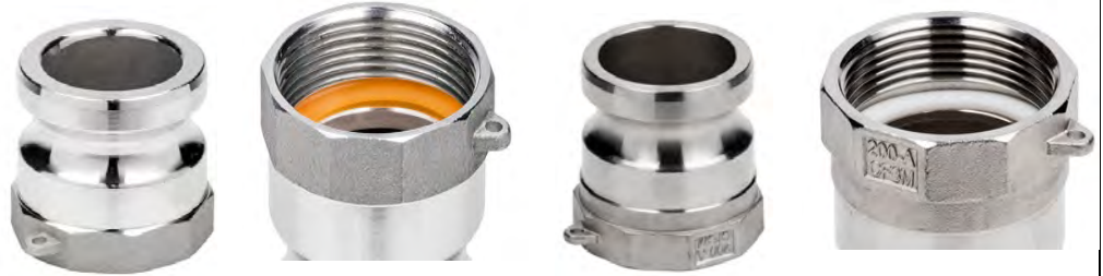
алюміній (поліуретанова плоска прокладка)