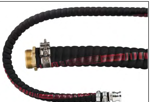
Шланг IVALO DN19 із 3/4" алюмінієвим з'єднанням CAMLOCK E (AC-E-075-A) закріплений черв'ячними хомутами з оцинкованої сталі та IVALO DN38 з латунним з'єднанням з зовнішньою різьбою BSP 1,1/2" (GD-VRSB-38-38-MS), закріпленим черв'ячними хомутами з нержавіючої сталі (AB-HDC-048-051-W5).