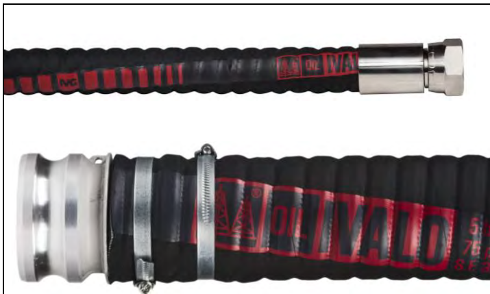
Шланг IVALO DN25 з гідравлічний фітінг з внутрішньою різьбою 1" BSP з нержавіючої сталі AISI 316 (TI-ZBW110-16-16-SS) з втулкою (TI-L-37-16-SS) з нержавіючої сталі AISI 304 і IVALO DN76 з роз'ємом CAMLOCK E 3" з алюмінію (AC-E-300-A), змонтованим за допомогою хомутів (AB-03009009) з оцинкованої сталі.

Примітки: індекси, виділені кольором, - найбільш часто використовувані; * - приблизні значення через гофровану конструкцію шлангу